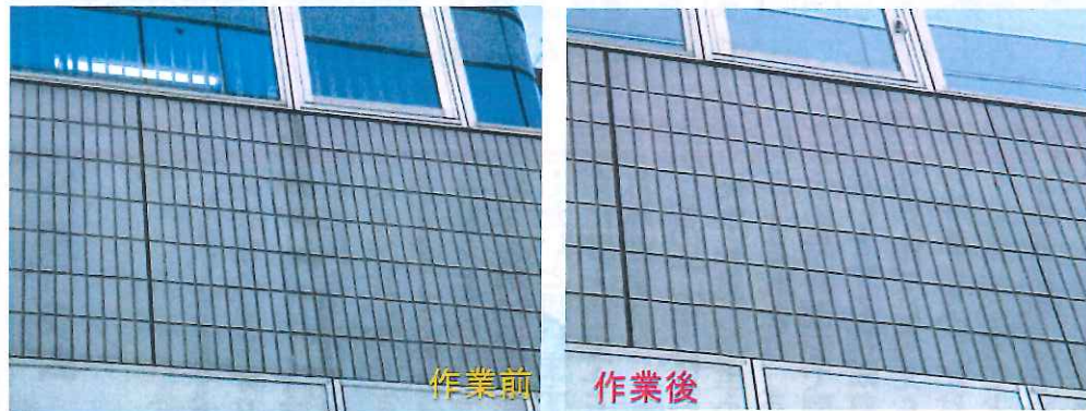
○エフロ除去作業写真

慣れている作業とはいえ、安全対策は第一です。近隣の歩道を行きかう歩行人や植込みなどにも気を付けて作業します。