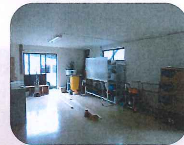
南側はこれからです