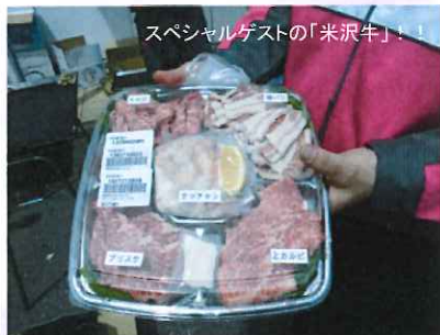
スペシャルゲストの「米沢牛」!

4月22日(土)、毎年恒例の「お花見」を開催いたしました。天候も快晴、気温も温かく絶好のお花見日和になりました。弊社社屋のお隣には「泉整形外科病院」様のキレイな桜が毎年花を咲かせますが、今回は開催数日前の強風によって散り、葉桜になってしまいました。しかしそこは花より団子で、バーベキューや焼きそばなど美味しい食事に、更に今年は「米沢牛」のお肉も登場!感動の味でした。