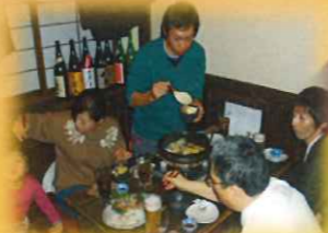
温かい鍋を囲んでの 楽しいひととき