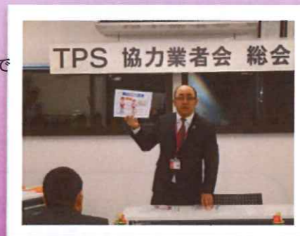
(業者会での説明の様子)

今期はTPSサービスとして制服の着用ルールを再確認・周知徹底に取り組んでおります。普段着慣れている制服もついルールを守れてない部分もあるのではないのでしょうか？ 社内でも朝礼時に制服チェックがありますが、スタッフ全員が改めて意識して制服を着こなしましょう！