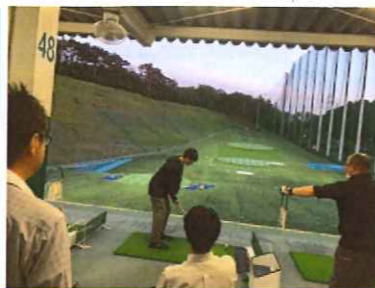
皆に見られての練習風景

『ナイスショット!』久しぶりにゴルフ練習場に社員の声が届いてきました。弊社の南側には虹の丘ゴルフ練習場があり、毎日練習をするのには絶好の環境です。この時期だからなのか、朝7時前にも多くの方々が早朝練習を行っている姿をお見掛けします。コロナの影響でゴルフコースに行く機会も減った一方で、社内では数年振りにクラブを握ったり、初めてのラウンドに向けて練習する方が増えてきました。今年も状況を見ながらですが7月に皆でラウンドする機会を設けて楽しみたいと思っております。ラウンド結果は次月号で報告致します。お楽しみに!