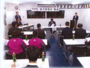
協力業者会の様子

マスタースクールや協力業者会でも講師として様々な情報、注意点などを共有してまいります。