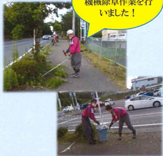
先日、当社周辺も機械除草作業を行いました！

これも一度行ってもまた、したたかに生えてくるものなので、除草剤との合わせ技を使う場合もあります。但し周りの植栽も枯らせてしまう場合もあるので、散布には要注意です。