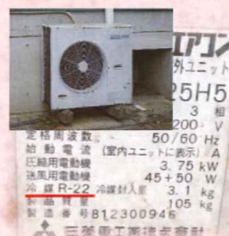
▲R22冷媒かそうでないかは室外機のラベルで確認可能

「R22冷媒」(=フロンガス)は塩素を含み、地球温暖化に多大な影響を及ぼすオゾン層を破壊することが確認されています。そこで現在は代替冷媒としてオゾン層を破壊する要因である塩素を使用しない新たな冷媒(R410、R32)が開発され、実用化していることからR22は2015年に削減開始、2020年には完全撤廃へと踏み切ることになったのです。(政府間国際協定:モントリオール議定書及びオゾン層保護法)それにより、R22冷媒ガスがかなり入手困難になり、メーカーはR22冷媒用の部品を製造できなくなります。簡単に言うと、 今後R22冷媒のエアコンの修理はかなり高額、モノによっては不可能になります。