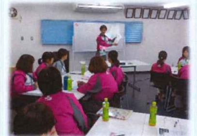
マスタースクールの様子