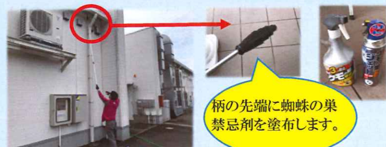
柄の先端に蜘蛛の巣禁忌剤を塗布します。

▲蜘蛛の巣は高所に張りがちです。それは「人間の手が届かないことを見越して張る習性がある」と言われています。