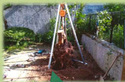
抜根前に切った枝と幹