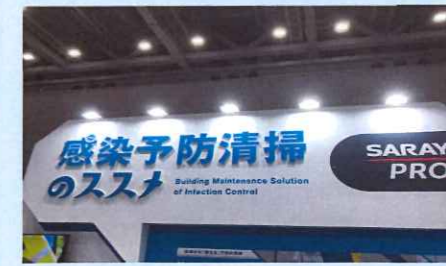
感染症予防商ブース