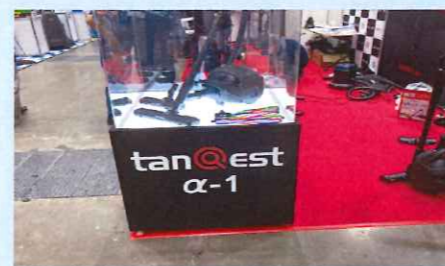
アップライト型ではない回転ブラシ式掃除機