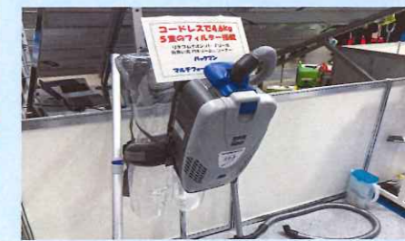
コードレス背負い型掃除機