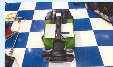
軽量で折りたためる自動洗浄機