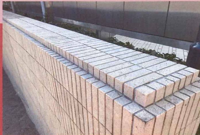
汚れの原因は黒カビです。カビ専用洗剤で綺麗に！