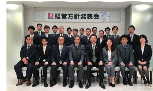
31期経営方針発表会にて

TPSに関わる全てのステークホルダーから、安心、信頼を得てお互いに笑顔になれるようなそんな組織作りを私たちは目指します